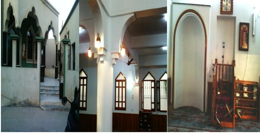
3- جامع الجويلي

مسجدي (الجويلي- الخشيبات) بمدينة طرابلس اللذين أنشأ في الفترة ما بين (2002-2004 م) واستبدلا بالجدران الإسمنتية والدهانات العصرية في الحوائط. وأصبحت المحراب عبارة عن تجويف بسيط داخل حائط القبلة كما هو موضح فيما يلي:-