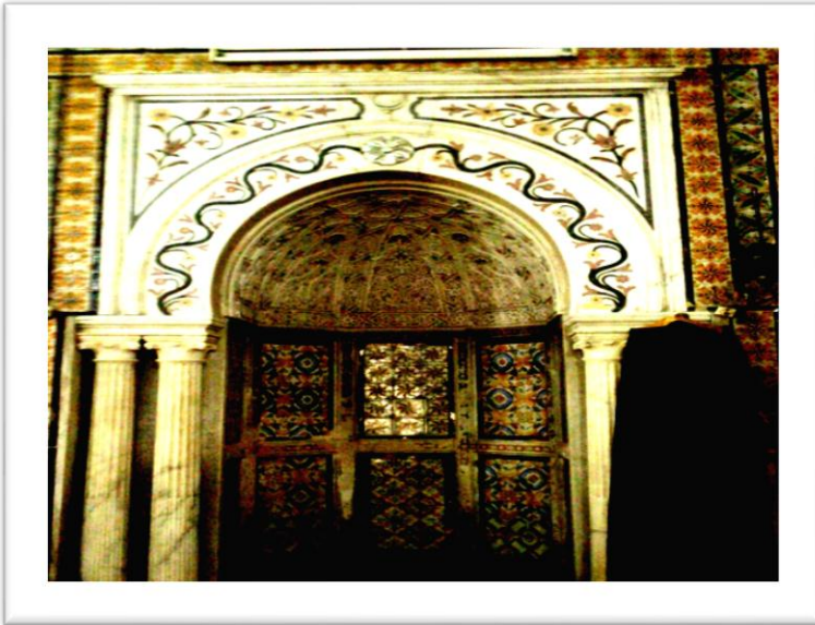
استخدام البلاط الخزفي لتعشيه المحاريب في المساجد

إلى جانب الرخام و الجص فقد برع الفنانون المسلمون في استخدام مختلف أنواع البلاطات الخزفية لتغطية المحاريب. وكان أول ظهور لبلاطات الخزف في المحاريب عبر عدد من بلاطات الخزف ذي البريق المعدني صنعت في سامراء بالعراق ثم أرسلت ليزين بها محراب سيدي عقبة بالقيروان وهي باقية إلى يومنا هذا. وقد تنافس الغرب الإسلامي مع الشرق في الشغف باستخدام الخزف لزخرفة المحاريب. ففي بلاد المغرب والأندلس، وخاصة في عصر الموحدين استخدم "الزليج" بزخارفه الهندسية الدقيقة والمتعددة الألوان على نطاق واسع حتى بات من مميزات الفن الإسلامي الرئيسة هنالك.