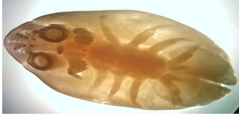
شكل (2): طفيلي Argulus sp.

حيث أضفت هذه الدراسة ولو بصورة مبسطة قليلاً من الضوء على بعض أنواع القشريات المتطفلة على أسماك الفروج التي تم تجميعها من المياه البحرية لساحل مدينة الخمس. ونأمل في المستقبل القيام بالمزيد من البحوث والدراسات على الطفيليات بصفة عامة وليس بالخصوص القشريات المتطفلة ، بحيث يتم التعريف بمده الطفيليات ودورة حياتها وتأثيرها المرضي على الأسماك المصابة بها.