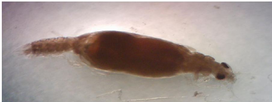
شكل (4): طفيلي Gnathia maxillaries