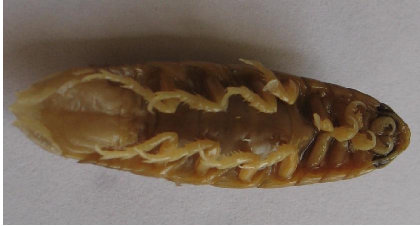
شكل (5): طفيلي Anilocra physodes