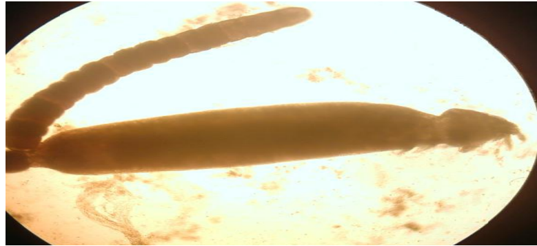
شكل (3): طفيلي Hatschekia sp.