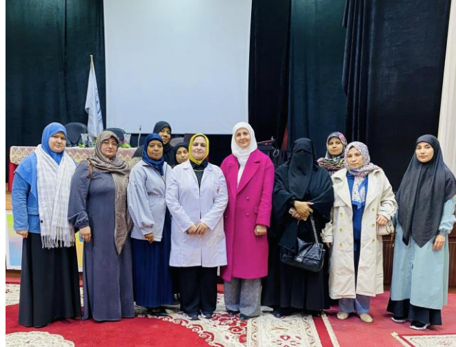
فعالية مدرسية لتعزيز الاستخدام الرشيد للمضادات الحيوية ضمن أسبوع AMR العالمي (18-24 نوفمبر 2025)